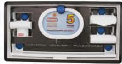
سرویس ۵ پارچه