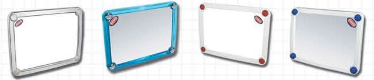
آینه تمام کرم