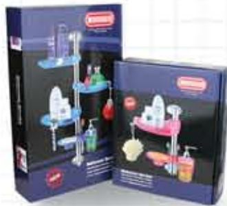
سرویس ۴ پارچه