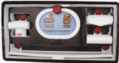
سرویس ۵ پارچه