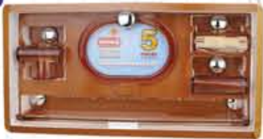
سرویس ۵ پارچه