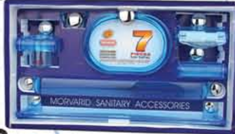
سرویس ۷ پارچه