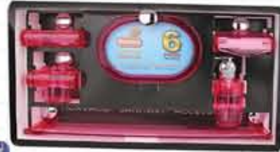
سرویس ۶ پارچه